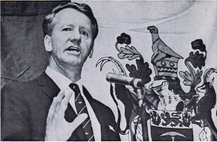
Ian Smith, Ministerpräsident von Rhodesien (zu: Die UNO will Krieg in Südrhodesien, S. 40)